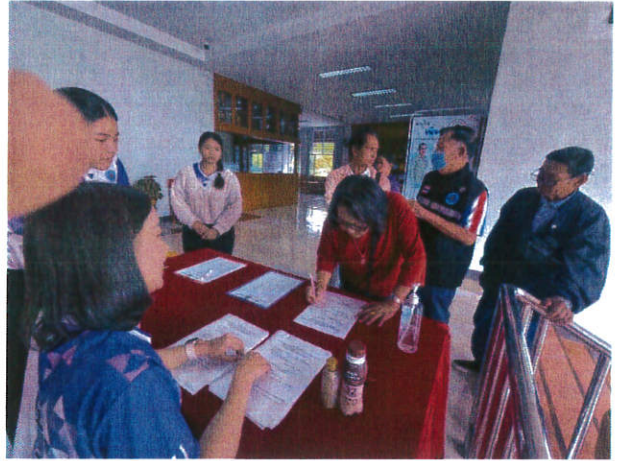
การลงทะเบียนเข้าร่วมการฝึกอบรม