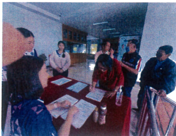
การลงทะเบียนเข้าร่วมการฝึกอบรม