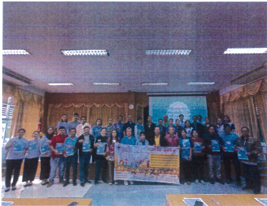
กิจกรรมการมอบป้ายประชาสัมพันธ์ หมู่บ้านละ ๑ ป้าย และมอบภาพอินโฟกราฟฟิก หมู่บ้านละ ๕๐ แผ่น