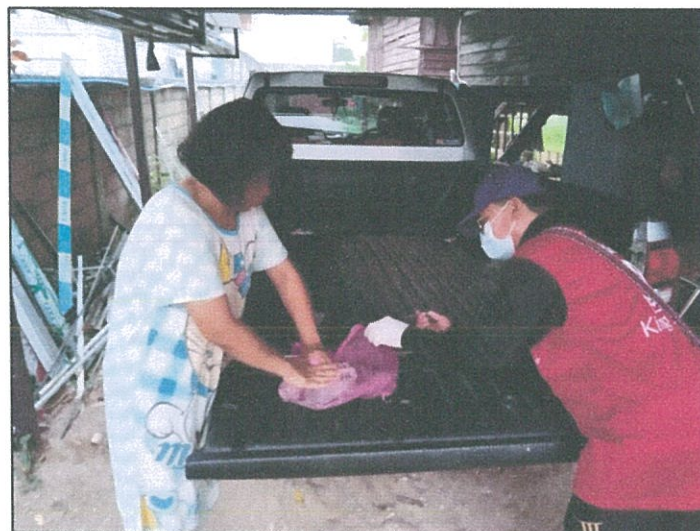
อาสาสมัครปศุสัตว์ ดำเนินการ ฉีดวัคซีนป้องกันโรคพิษสุนัขบ้า ในพื้นที่รับผิดชอบของแต่ละหมู่บ้าน