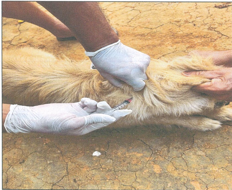
อาสาสมัครปศุสัตว์ ดำเนินการ ฉีดวัคซีนป้องกันโรคพิษสุนัขบ้า ในพื้นที่รับผิดชอบของแต่ละหมู่บ้าน