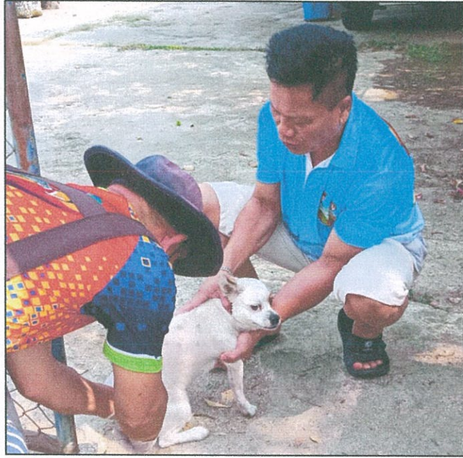
อาสาสมัครปศุสัตว์ ดำเนินการ ฉีดวัคซีนป้องกันโรคพิษสุนัขบ้า ในพื้นที่รับผิดชอบของแต่ละหมู่บ้าน