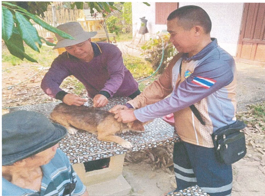
อาสาสมัครปศุสัตว์ ดำเนินการ ฉีดวัคซีนป้องกันโรคพิษสุนัขบ้า ในพื้นที่รับผิดชอบของแต่ละหมู่บ้าน