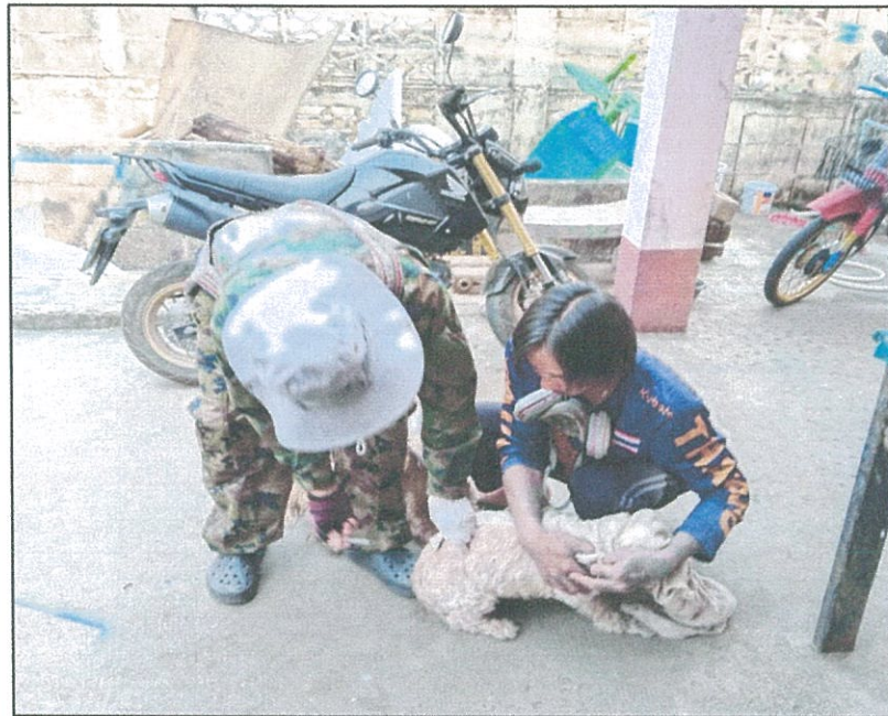
อาสาสมัครปศุสัตว์ ดำเนินการ ฉีดวัคซีนป้องกันโรคพิษสุนัขบ้า ในพื้นที่รับผิดชอบของแต่ละหมู่บ้าน