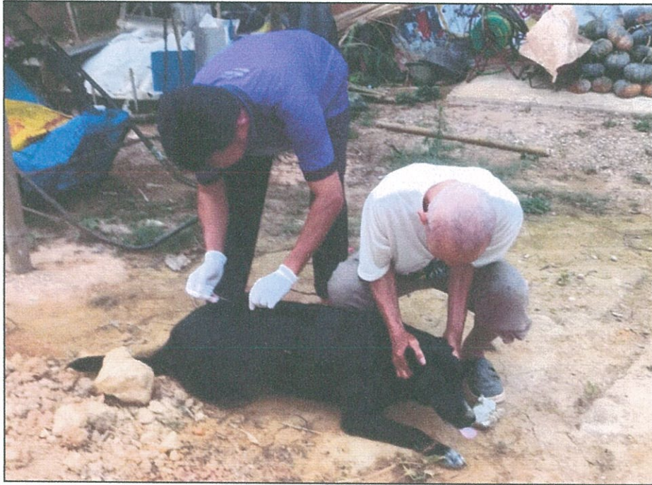
อาสาสมัครปศุสัตว์ ดำเนินการ ฉีดวัคซีนป้องกันโรคพิษสุนัขบ้า ในพื้นที่รับผิดชอบของแต่ละหมู่บ้าน